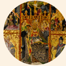
Retablo de San Blas Juan de Bonilla (menor) s. XV Gótico hispanoflamenco Iglesia de San Lorenzo