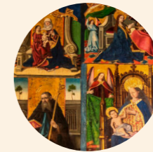
Retablo de la Virgen con el niño Miguel Ximénez y Juan de Bonilla s. XV Gótico hispanoflamenco Iglesia de Santiago el Mayor