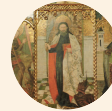
Retablo de San Bartolomé Desconocido s. XV Gótico Iglesia de la Virgen del Rosario