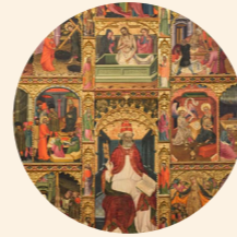
Retablo de San Pedro Martín del Cano s. XV Gótico internacional Iglesia de San Pedro