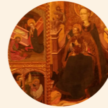
Retablo de la Virgen Martín del Cano y Maestro de Retascón s. XV Gótico internacional Iglesia de la Virgen de la Asunción