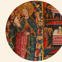
Retablo de la Virgen de los Ángeles Martín del Cano s. XV Gótico internacional Iglesia de Nuestra Señora de la Asunción