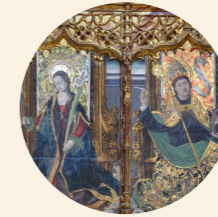
Predela de Sta. Apolonia, Sta. Águeda, San Agustín, Sta. Brígida, San Quílez y Sta. Bárbara Martín Bernat s. XV Gótico hispanoflamenco Iglesia de San Lorenzo